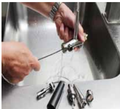
Abb. 5: Zerlegte Zapfhähne (Bier, Postmix) zur gründlichen Reinigung