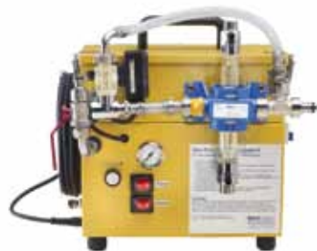
Abb. 10: Mobiles chemisch-mechanisches Reinigungsgerät