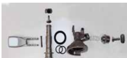
Abb. 6: Zerlegter Zapfkopf zur gründlichen Reinigung