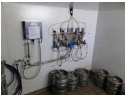
Abb. 9: Automatisches chemisches Reinigungsgerät für Leitungen (Dosiervorrichtung und Steuereinheit)

Beispielhaftes chemisches (Abb. 9) und chemisch-mechanisches Reinigungsgerät (Abb. 10).