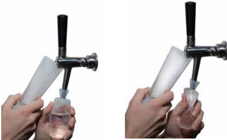
Abb. 2: Spülen des Hahnauslaufes und der Luftbohrung mittels Reinigungsball

Bitte führen Sie alle Arbeiten nur mit gründlich gewaschenen Händen durch.