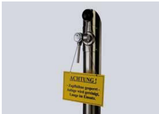
Abb. 8: Beispielhafter Warnhinweis

Achtung: Falls während der Reinigung die Entnahme von Reinigungsmitteln über die Zapfarmatur möglich ist, muss an dieser Stelle ein geeigneter Warnhinweis für die Dauer der Reinigung angebracht sein (Abb. 8).