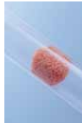
Abb. 12: Gepresste Schwammkugel im Leitungssystem