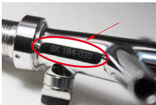
Abb. 1: Beispielhafte Schankarmatur (hier: Zapfhahn) mit SK-Kennzeichnung

Hinweis: Wenn Sie Bauteile ohne SK-Kennzeichnung verwenden, müssen für die Überprüfung der Getränkeschankanlage entsprechende Herstellerbescheinigungen (z. B. Konformitätserklärung, Bestätigung der lebensmittelrechtlichen Unbedenklichkeit) vor Ort vorliegen.