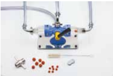
Abb. 11: Beispielhaftes Reinigungsgerät mit Schwammkugeln und Reinigungstablette zur chemischen Reinigung

Jede Schwammkugel darf nur einmal benutzt werden, da sich in den Poren der Kugeln Mikroorganismen sammeln.