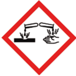
Abb. 13: Kennzeichnung eines Stoffes mit Ätzwirkung

Geeignete Reinigungsmittel für Getränkeschankanlagen sind in der Regel ätzende Stoffe (Abb. 13). Dies bedeutet, dass bei Kontakt Haut oder Augen verletzt werden können. Sie dürfen niemals Reinigungsmittel miteinander vermischen, hierbei können giftige Gase (z. B. Chlorgas) entstehen oder ätzende Flüssigkeiten unkontrolliert spritzen.